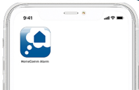
Fig. 2 App